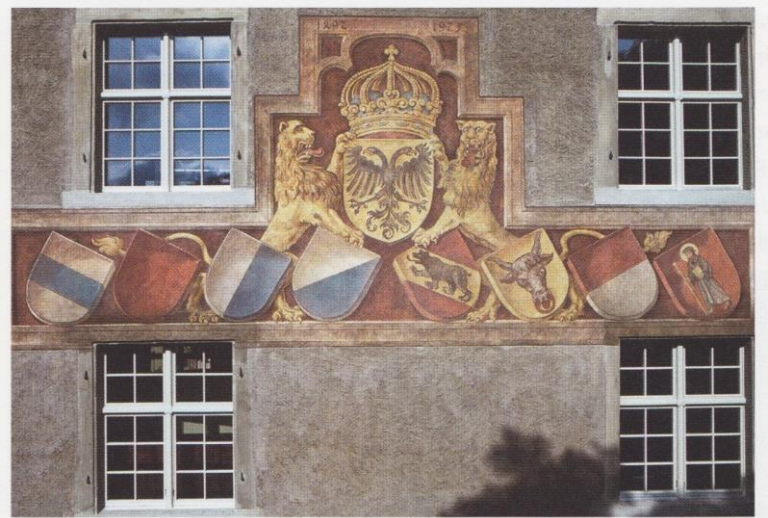
Die Wappen der acht alten Orte auf dem Landvogteischloss in Baden AG, 1492 6.7

Interpretieren Sie die unten abgebildete Darstellung . Ordnen Sie dieselbe in den historischen Hintergrund ein und erläutern Sie, wie man sich die entsprechende Zeit in Bezug auf die politische Organisation vorzustellen hat.